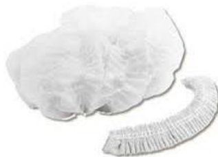
Figura 07: Gorro/Touca descartável

Deve ser utilizado em procedimentos que podem gerar aerossóis, para a proteção dos cabelos e cabeça dos profissionais. Em nossos serviços estamos recomendando a utilização de gorro/touca descartável para todos os profissionais. Após a utilização, os gorros/toucas devem ser descartados no lixo infectante.