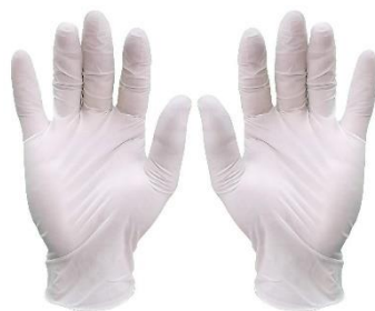
Figura 03: Luvas de procedimento

As luvas devem ser colocadas dentro do quarto do paciente ou área de atendimento ao paciente. As luvas devem ser removidas, utilizando a técnica correta, ainda dentro do quarto ou área de atendimento ao paciente e descartadas como resíduo infectante.