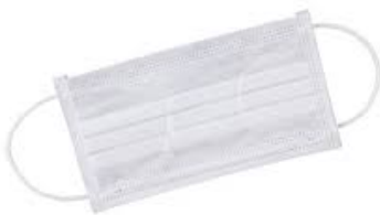
Figura 01: Máscara cirúrgica